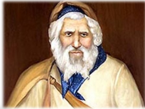
רבי יעקב אבוחצירא (כ' טבת)